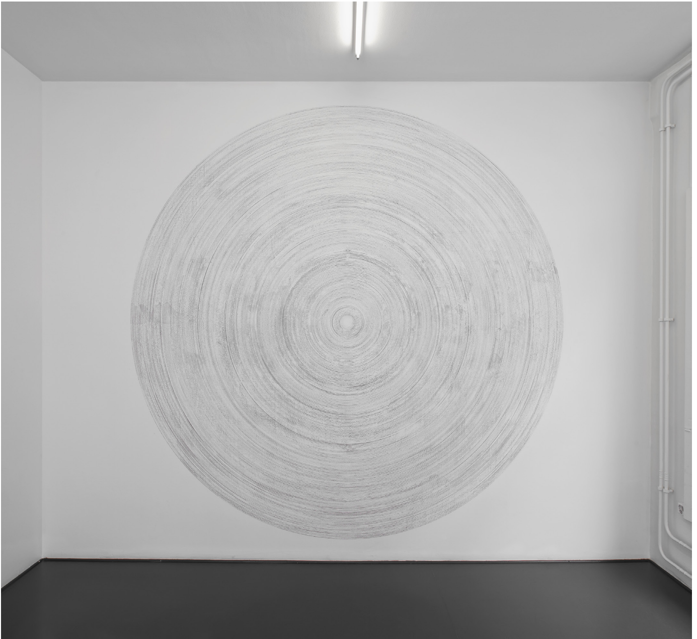
Crop Circle , 2016

Installation, graphite sur mur / Wall drawing, graphite dimensions variables / Various sizes