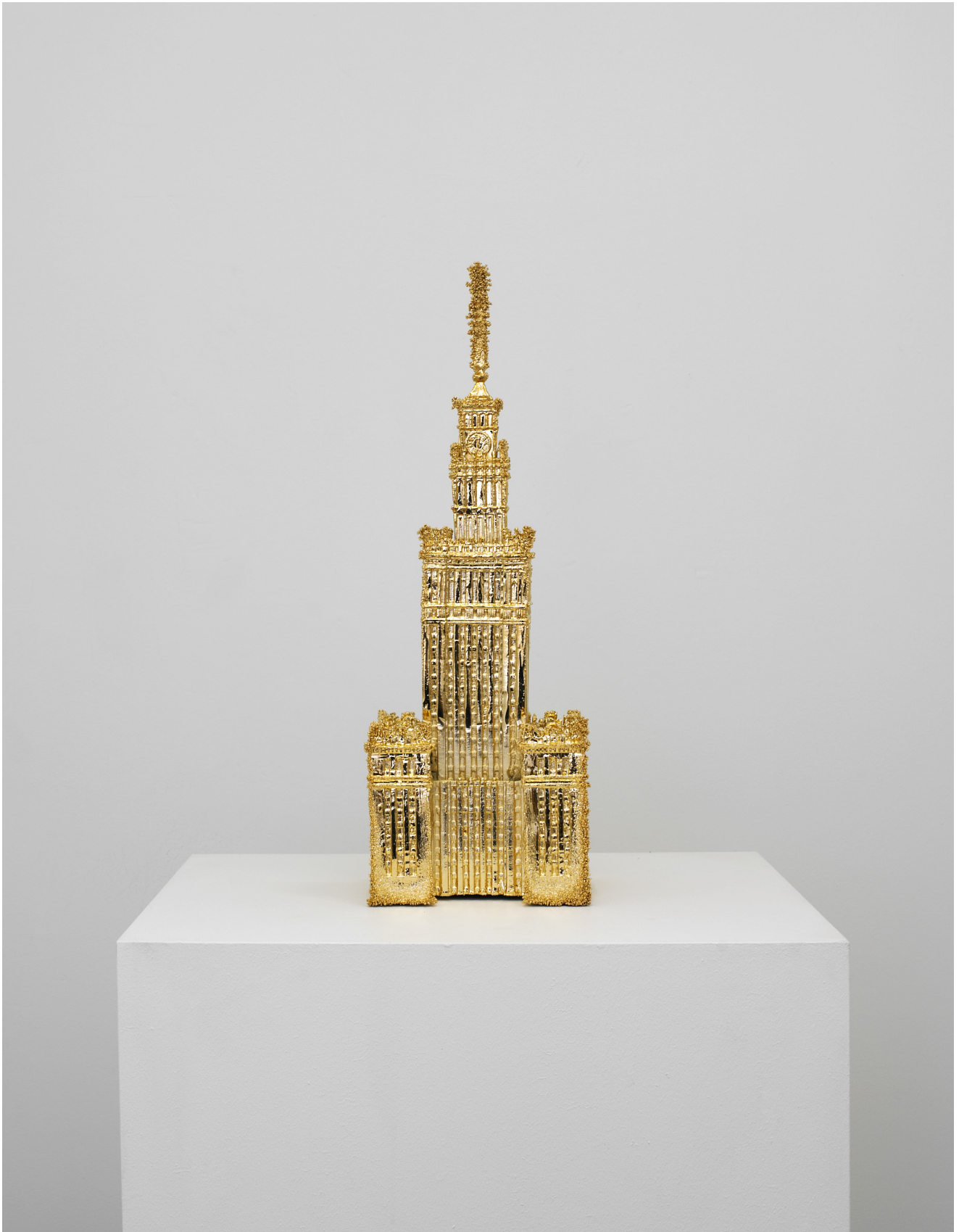
Nostalgia Little Mutant , 2016

Moulage en bronze, plaqué or 24 carats / Bronze cast, french-gold plated 24K