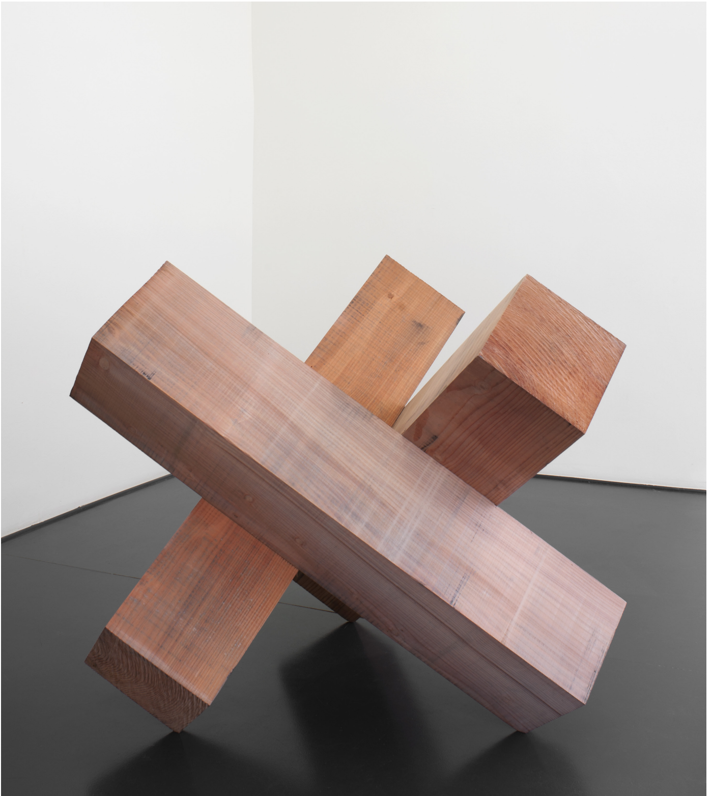
Matrice , 2016 Séquoia de Genève / Sequoia from Geneva 3 x (30 x 30 x 120)cm