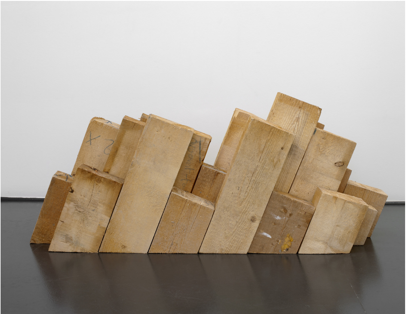
Stère , 2016 Mélèze / Larch Dimensions variables