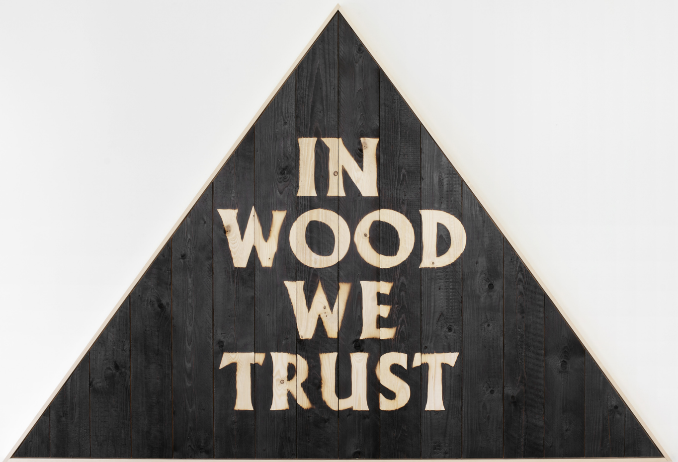
Firestarter , 2016 Sapin brûlé / Burnt Pine tree 150 x 240 cm

Les Frères Chapuisat Trial and Error Galerie Laurence Bernard, Genève 17 mars / 30 avril 2016