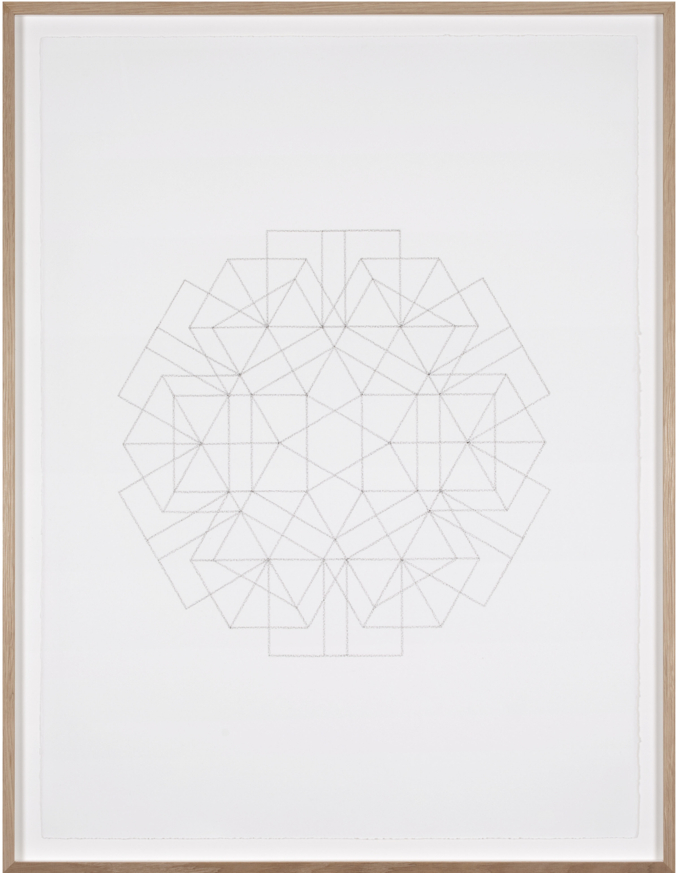
Dessin #5, 2016

Fusain sur papier coton / Charcoal on cotton paper 75 x 56 cm (sans cadre) / 82 x 63,5 cm (encadré)