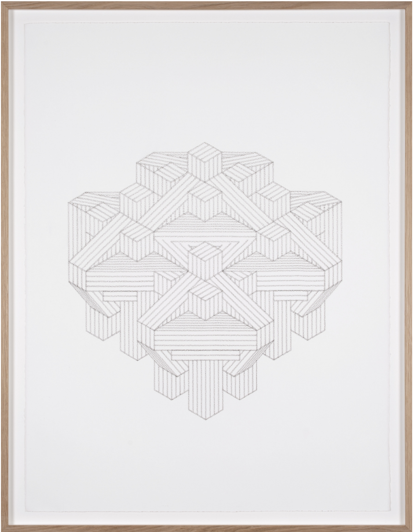
Dessin #3, 2016

Fusain sur papier coton / Charcoal on cotton paper 75 x 56 cm (sans cadre) / 82 x 63,5 cm (encadré)