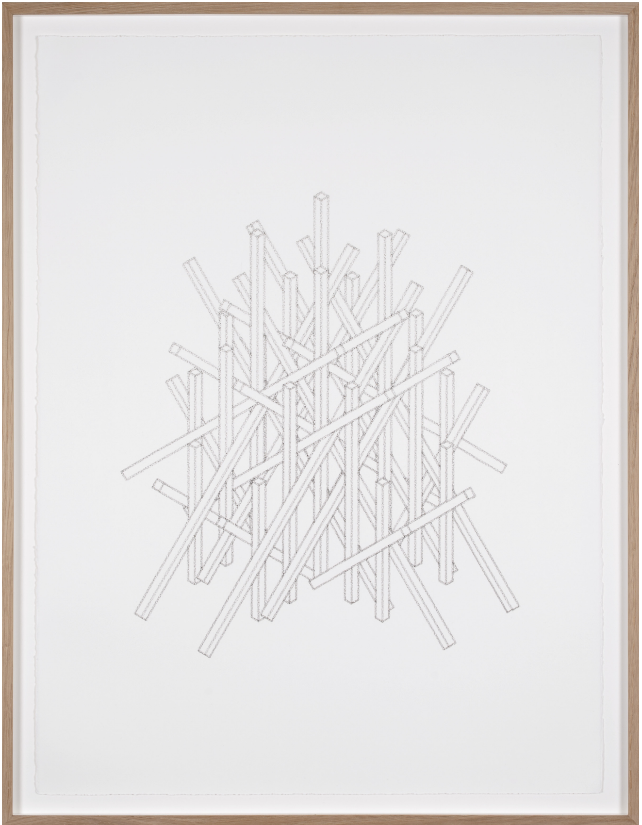
Dessin #2, 2016

Fusain sur papier coton / Charcoal on cotton paper 75 x 56 cm (sans cadre) / 82 x 63,5 cm (encadré)