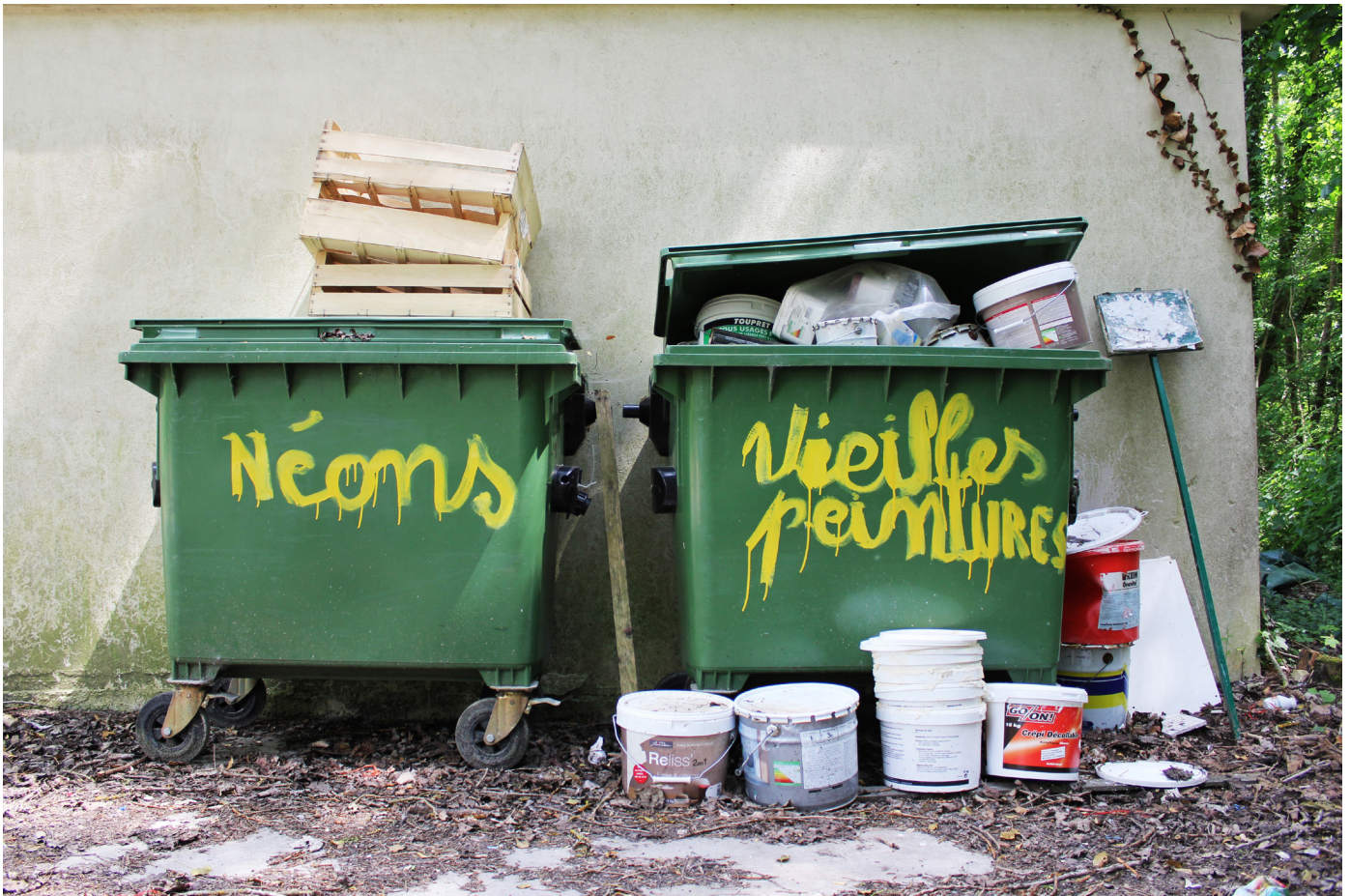
Néons et vieilles peintures, 2016

Impression sur dibond / Print on aluminium