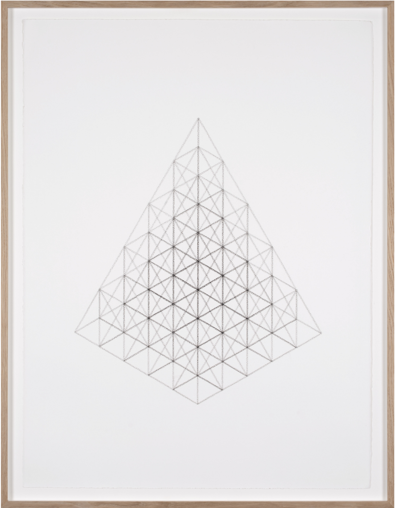
Dessin #1, 2016

Fusain sur papier coton / Charcoal on cotton paper 75 x 56 cm (sans cadre) / 82 x 63,5 cm (encadré)